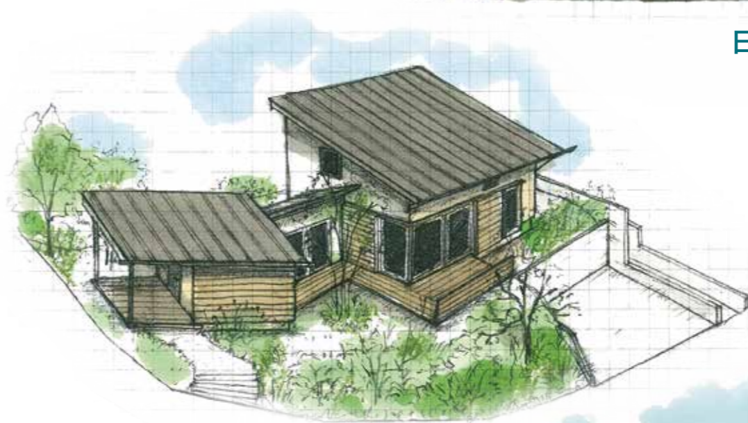
飯能市 I 邸