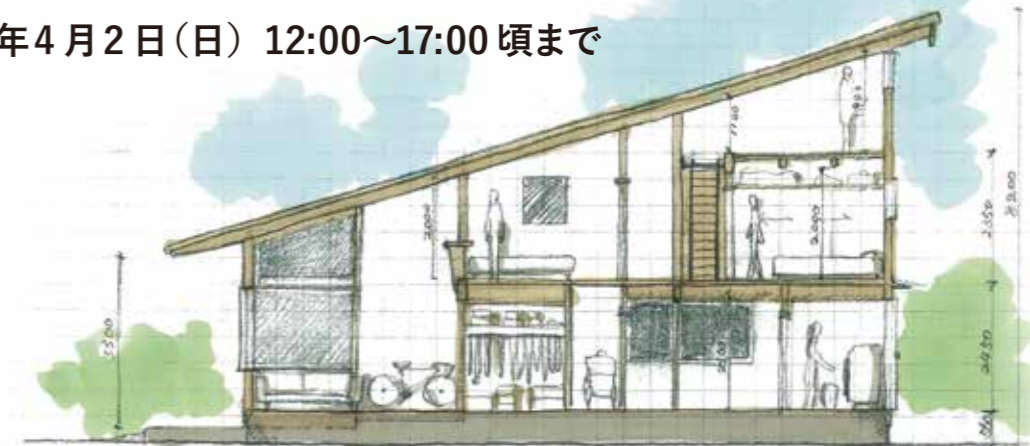
日高市 N 邸