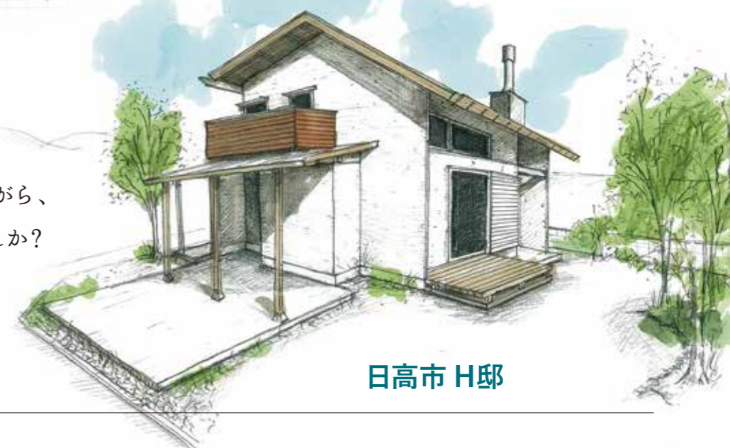
日高市 H 邸